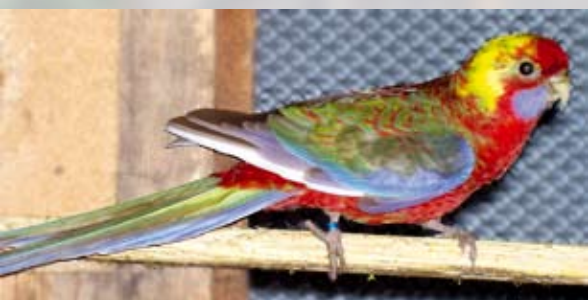
0,1 dominantní červená skořicová straka