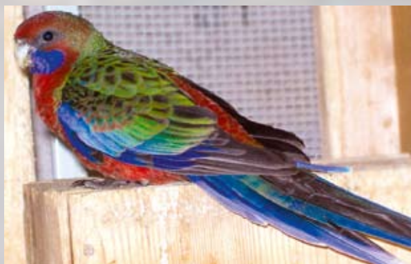
0,1 červená tmavá (1F), mladý pták

uvařené vejce a podávám denně. Samozřejmě dostávají veškeré pro mne dostupné zelené krmění, dozrávající obilí a různé plody, zejména pampelišku, ptačinec, vojtěšku, jitrocel, pšenici, slunečnici, kukuřici, jeřabiny, šípky a jablka. Dále mají ptáci ke stálé dispozici v miskách grit od firmy Versele-Laga a sépiovou kost. Zhruba 1× za měsíc rozmačkám každému páru do vody jeden stroužek česneku. Žádné vitaminové ani minerální preparáty nepoužívám. Jelikož se v posledních letech začíná chovem penantů, a zvláště jejich mutacemi, zabývat stále více chovatelů, chtěl bych se zmínit o jednom nešvaru, který mezi chovateli panuje – a to je zmatek v názvech mutací a jejich kombinací. Jako příklad mohu uvést takzvanou „oranžovou“ mutaci. Tento název se používá jen na základě vizuálního vzhledu. Přitom se laicky řečeno jedná o jakousi