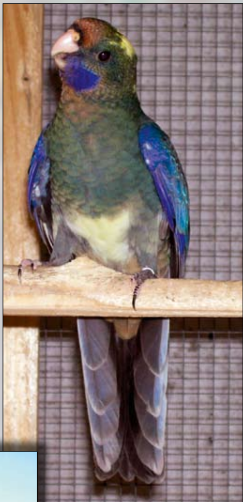
1,0 dominantní parblue tmavá straka (1F), mladý pták

Své penanty chovám v celoročních venkovních voliérách o rozměrech 3,5 × 1,8 × 1 m (délka, výška, šířka). Přestože část voliér má dřevěnou konstrukci, penanti ji neničí, neboť 1× týdně dostávají čerstvé větve na okus – v létě převážně vrbu a bezinky, v zimě pak borové a smrkové větve. Co se týče krmení, snažím se, aby bylo co nejpestřejší. Jelikož jsou ptáci celoročně venku, mohu v zimě podávat pouze směs suchých zrnin, která se skládá z prosa, lesknice, kardi, ovsa, slunečnice a semence. Vodu v zimě ptákům nedávám, pouze pokud nastane obleva, aby se mohli vykoupat. Každý pár dostává denně půlku pomeranče. To praktikuji již několik let a velmi se mi to osvědčilo. Jelikož se penanti rádi a často koupou, měl jsem s tím v mrazech problém. Vždy, když dostali vodu, hned se vykoukali a peří na nich zmrzlo tak, že nemohli ani létat. Pomeranč je dobrý zdroj tekutin a vitamínů, nevádí, když zmrzne, a ptáci ho konzumují. Je však nutné je před podáváním dobře omýt, neboť bývají často chemicky ošetřeny a některé páry konzumují i kůru. Jakmile přejdou mrazy, začnu krmit uvedenou směs zrnin mimo semence, který nahradím pšenicí a podávám ji namočenou, respektive naklíčenou. Množství