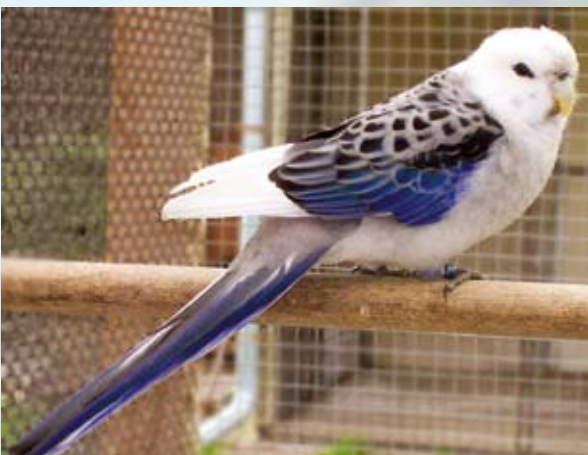
1,0 dominantní modrá straka